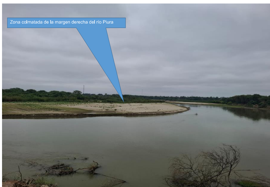
Figura N° 03: Se observa la colmatación en el cauce del río Piura obstruyendo ingreso del agua a la bocatoma El Papayo.