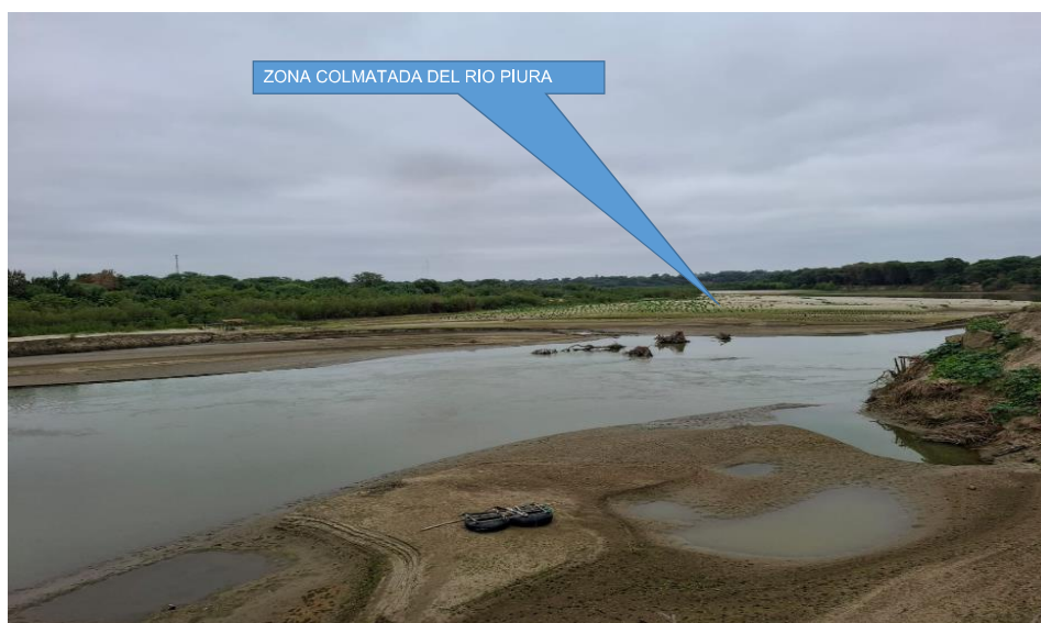
Figura N° 01: Se observa la colmatación en la margen derecha del cauce del río Piura